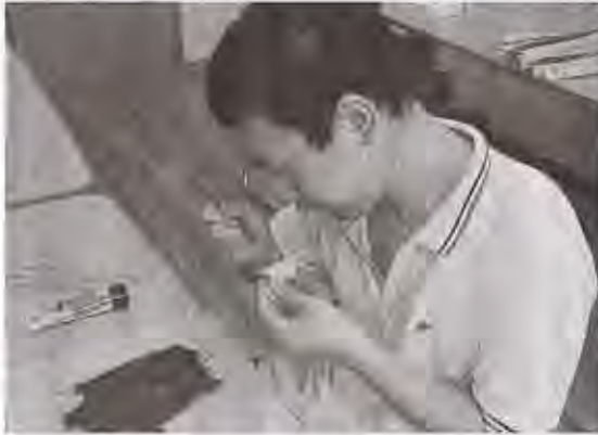
①キーホルダーの色を塗るラポール川原の利用者。静岡市駿河区で②製作したキーホルダー