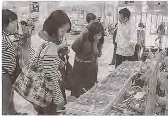
多彩な種類の商品が並ぶ販売会 ＝静岡市駿河区のアピタ静岡店

静岡市駿河区のNPO法人オールしずおかベストコミュニティは2日、市内の障害福祉事業所4カ所で作成した商品の販売会を同市駿河区のアピタ静岡店で開いた。パウンドケーキやクッキーなどの食品、カードケースやポーチといった縫製品など、利用者ら手作りの多彩な商品を販売した。来場客は興味深そうに商品に見入った。