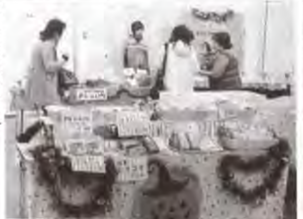
ハロウィンにちなんだ福祉施設の授産製品が並ぶ＝沼津商連会館ビル1階で

ウインにちなむデザイ ンの授産品を展示販売しており、パン、縫製雑貨、焼き菓子や、三島市の就労継続支援B型事業所クリーム・ド・クオーレによる人気の「かぼちゃプリン」も並ぶ。千円以上の購入者先着五十人にラスクを進呈。 営業時間は午前十時から午後四時。