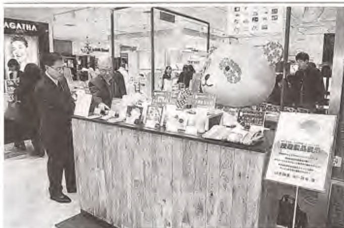
クラウドファンディングで作製した授産品をPRする販売台＝28日午後、静岡市葵区の松坂屋静岡店

松坂屋静岡店（静岡市葵区）と、NPO法 人オールしずおかベストコミュニティが管理