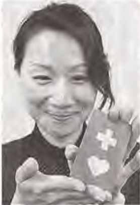
市役所などで配布を開始したヘルプカード ＝浜松市役所

浜松市は5日、外見からでは分からない障害や病気のある人が援助や配慮を必要としていることを周囲に知らせる「ヘルプマーク」の配布を市役所などで始めた。 ヘルプマークは東京都が作成し、全国に広まりつつある。人工関節や義足、内部疾患、発達障害、妊娠初期な 浜松市では、外部から個人情報が見えにくい形で、より細かな情報を記入できる市独自の「ヘルプカード」導入も検討中で、関係機関と調整を進めている。 (浜松総局・青島英治)