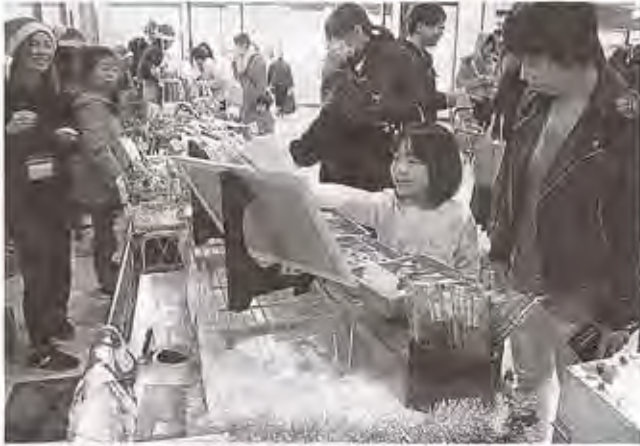
事業所で作られた焼き菓子などが並んだ販売会 ＝清水町

クなどの焼き菓子のほか、プレスレットや目に控えたクリスマスグッズなど10種類超の製品を出品した。各事業所で働く人たちの工賃アップが狙い。各事業所のスタッフがサンタクロースの帽子をかぶるなどして季節感を出した。