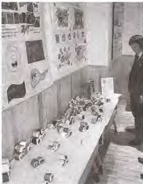
通所者によるアート作品＝磐田市の磐田信用金庫豊田支店で