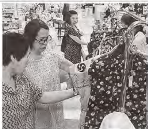
手作りの部屋着を見る買い物客 ＝静岡市葵区のJR静岡駅ビルパルシェ

福祉事業所の 手作り品販売 JR静岡駅ビル内 静岡市内の福祉事業所の製品を集めた「夏の販売会」(NPO法人オールしずおかベストコミュニティ主催)が19日、JR静岡駅ビルパルシェで始まった。21日まで。市内9事業所の利用者や職員が浴衣の生地