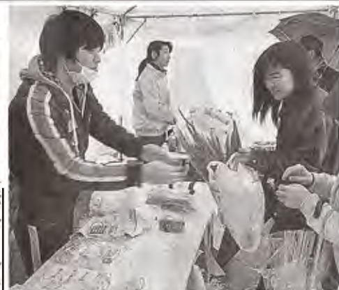
障害者が生産した野菜などを販売した マルシェ＝21日正午ごろ、静岡市葵区 の青葉イベント広場