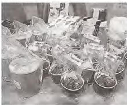
しずおか授産品ブランドに認定されて いる製品＝県庁

県が「しずおか授産 品ブランド」のお墨付 きを与えた授産品で、 2016年度に5品、 17年度に10品をそれぞ れ認定した。真心込め て一つ一つ手作りされ た授産品の質の高さを アピールし、販路拡大