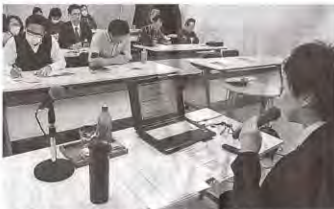
障害福祉事業所の職員を対象に開かれた経営セミナー 〓静岡市葵区の障害者働く幸せ創出センター