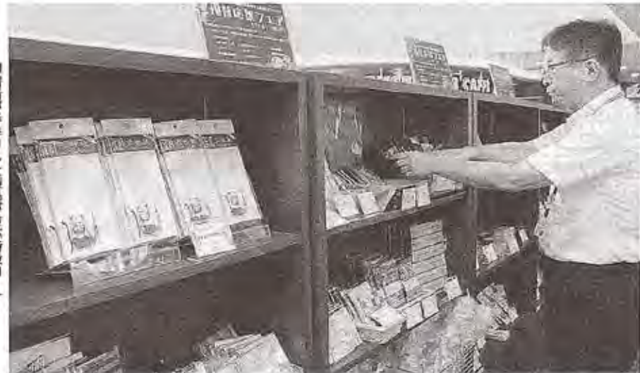
障害者が手作りした製産品が並ぶ特設コーナー 浜松市中区の谷島屋書店メイワン本店で

浜松市中区砂山町の谷島屋書店メイワン本店に1日、就労支援事業所に通う障害者が作った雑貨の特設コーナーが設置された。10月1日まで販売する。（飯田樹与）