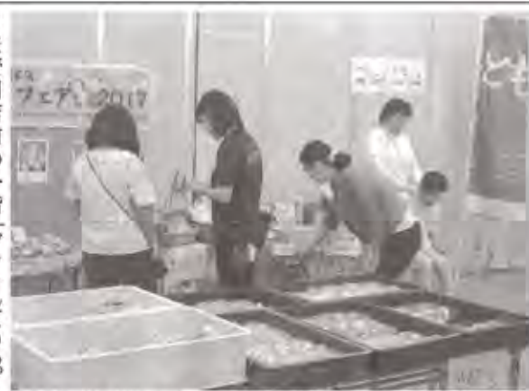
県東部地域の福祉施設の授産製品などが並ぶ会場 ＝沼津商連会館ビル1階で

きょうまで授産 製品の販売など 沼津駅南口前の沼津 商連会館ビル一階、と も沼津店は「七夕フェ ア」を、きょう二十四