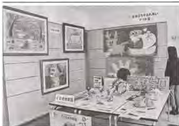
3施設の利用者による作品が並ぶ会場

トイレットペーパーなどを展示。きぼうの里は、県知的障害者福祉協会主催の愛護ギャラリーで銀賞に選ばれた絵画とちぎり絵の3作品を披露している。 作業実習で木材加工にも取り組む富士見学園からは、木材から削り出した干支(えと)の置物や積み木をはじめ、赤い布を星型に縫製したパーツを組み合