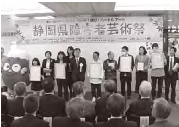
▲表彰式 授産製品コンクール 静岡県知事賞受賞者