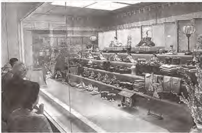
故高松宮妃の京びなに見入る来場者 =18日午後、静岡市駿河区のグランシップ

会場付近では、市内12の福祉事業所の利用者や職員が手作りしたおひなさまにちなんだ小物やお菓子など約500点の販売も行われている。