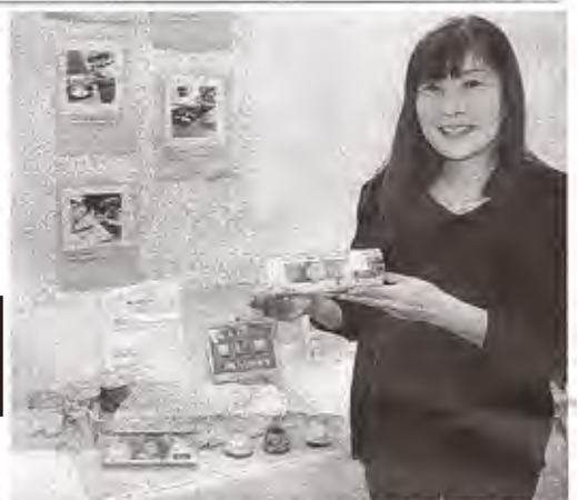
裾野市のみどり作業所が出品した「富士山マドレーヌ」＝静岡市葵区で

質などを百点満点で評価していた。 今回は二十回目を記念し、事業所に加えて特別支援学校の生徒が作った陶芸や布製品も展示された。 受賞製品は十一月にある県障害者芸術祭で表彰され、静岡伊勢丹（葵区）や松坂屋静岡店（同）などのイベントで販売される。主催したNPO法人「オールしずおかベストコ