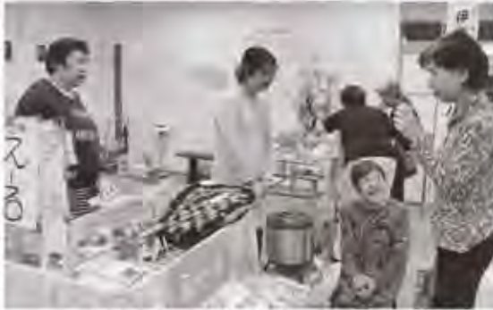
来場者に商品の試飲を勧めるスタッフ＝須美元和田の伊東ショッピングプラザ・デュオ