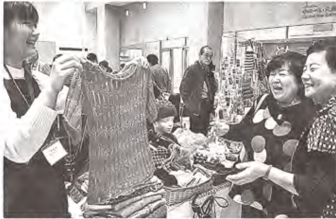
県中部を中心に20の福祉事業所が集まった「福祉商品販売会」＝静岡市駿河区のグランシップ

福祉商品販売会 雑貨や菓子1000点 駿河区で20事業所 「NPO法人オールしずおかベストコミュニティ」は25日、静岡市駿河区のグランシップで「福祉商品販売会」を開いた。県中部を中心に障がい福祉サービ