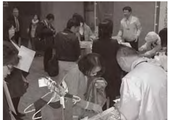
▲会場外のロビーでの「とも静岡店」授産製品販売会