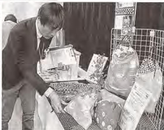
授産製品の品質などを採点する審査員 =5日、静岡市葵区

障害者が製作 縫製品など審査 県授産製品コンクール 県内の福祉事業所の障害者が作った製品を審査する「県授産製品コンクール」(NPO法人オールしずおかベストコミュニティ主催)が5日、静岡市葵区で開かれた。 授産製品の品質向上を目的に毎年開かれ、今年で20回目。県内58事業所が食品、縫製、木工製品、雑貨品など計91点を出品した。調理専門学校教員や百貨店のバイヤーら16人が審査員を務め、表現力や価格設定などをポイントに採点した。今回は