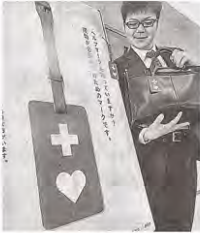
援助や配慮が必要と周囲に知らせるヘルプマーク。かばんなどに取り付けて使用する