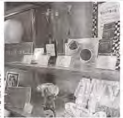
カードケースやお菓子などを紹介している展示スペース＝静岡市葵区の静岡伊勢丹で

県知事賞など受賞 授産製品コン展示 静岡伊勢丹 静岡市葵区の静岡伊勢丹で、十月の県授産製品コンクールで県知事賞などを受賞した製品の展示会が開かれている。二十日まで。菊川市の草笛共同作業所しずなみ作業場が作った卵の形の馬拉カス「エックシエイカー」、浜松市北区の多機能型事業所だんだんが作った遠州綿紬のカードケース、裾野市のみどり作業所が作った「Book型お薬手帳・通帳入れ」などが展示されている。主催したオールしずおかベストコミュニティの担当者には「デザインや質の良い製品をぜひ知ってもらいたい」と話した。会場では購入できない