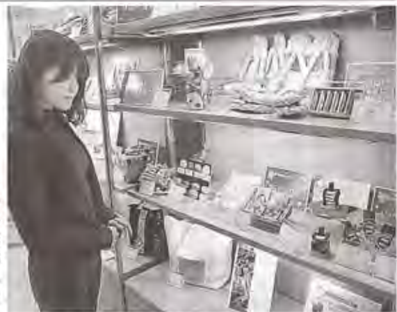
多様な授産製品が並ぶ展示会 ＝28日午後、静岡市葵区の静岡伊勢丹

れた24点。チョコレートケーキ「ベンチチョコラ」や、しいたけせんべい、通帳入れ、トートバッグなど多様な作品が並び、来場者を楽しませている。