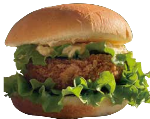
しいたけメンチバーガー Shiitake minced burger

テーブル状の砂栽培で、無農薬で安心・安全で優しいレタスを栽培しております。また自動換水システムにより余分な水や肥料を与えないストレス農法で、野菜本来が持つ生命力を引出した、味が濃くおいしいレタスです。