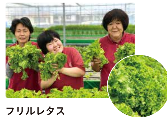
フリルレタス ruffle lettuce

テーブル状の砂栽培で、無農薬で安心・安全で優しいレタスを栽培しております。また自動換水システムにより余分な水や肥料を与えないストレス農法で、野菜本来が持つ生命力を引出した、味が濃くおいしいレタスです。